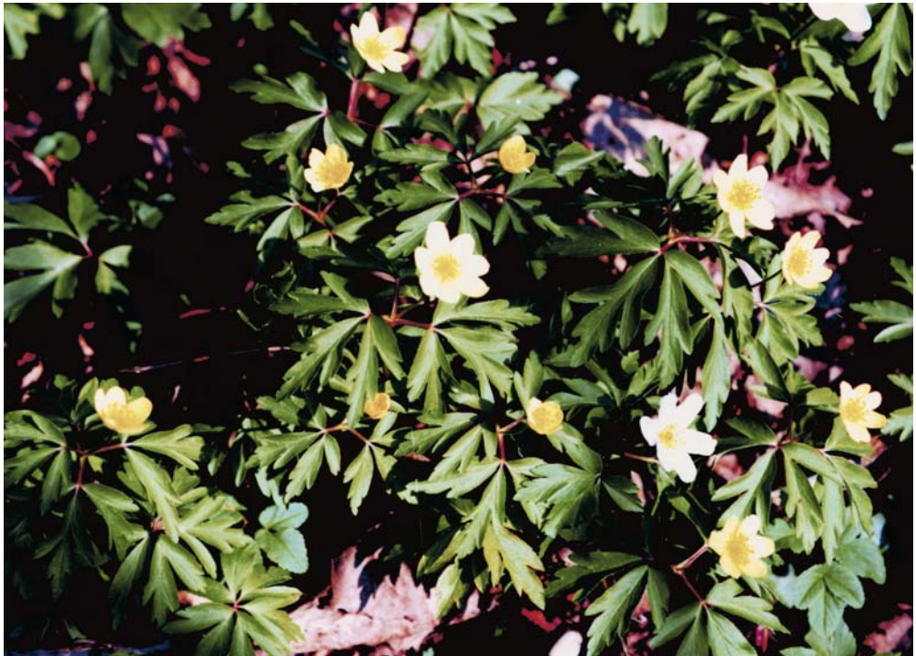
Abb. 2: Anemone × lipsiensis am Standort (15.04.2003)