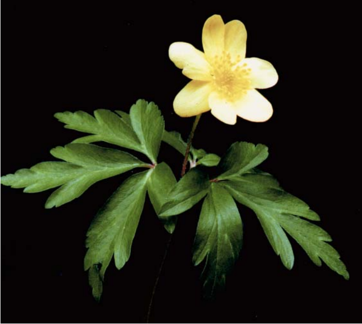
Abb. 3: Anemone × lipsiensis . Blütenspross

Für die Notomorphe aus dem Bürgerholz sind, im Vergleich mit den Elternarten, folgende Merkmale bezeichnend. Die Zahlenangaben beruhen auf Messungen bzw. Auszählungen mehrerer Exemplare vom Fundort.