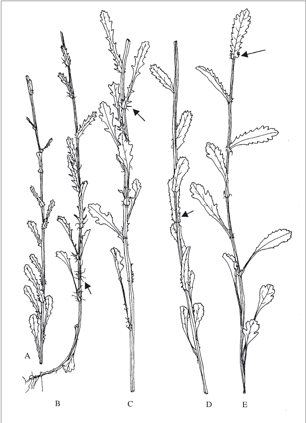
Abb. 2: Mittlere Stengelblätter von Leucanthemum vulgare LAM.: A – (NSG “Tote Täler”, DR 005673), B – (Mansfeld, DR 005640), C – (Wettin, DR 005675) und Leucanthemum ircutianum DC.: D – (Liebenau, DR 003046), E – (Harzgerode, DR 005665).