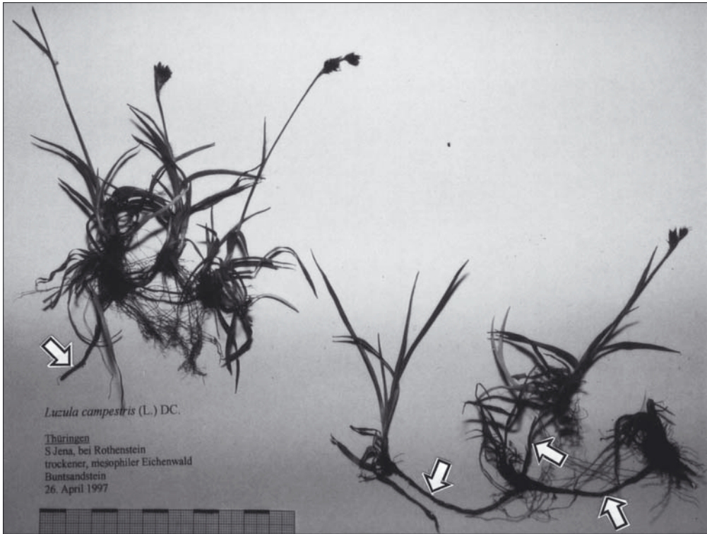
Abb. 4: Habitus von Luzula campestris (L.) DC. bei Jena. April 1997. Die Pfeile markieren die mehrere cm langen Ausläufer.

L. multiflora und L. congesta können - wie oben erwähnt - habituell L. divulgata ähneln, sind aber durch das Antheren-Filament-Verhältnis von \pm 1:1 (bis in Ausnahmen 2:1), den deutlich länglichen, nie kugeligen Samenkörper sowie in der Blütezeit (frühestens Anfang Mai bis Juli) von L. divulgata getrennt.