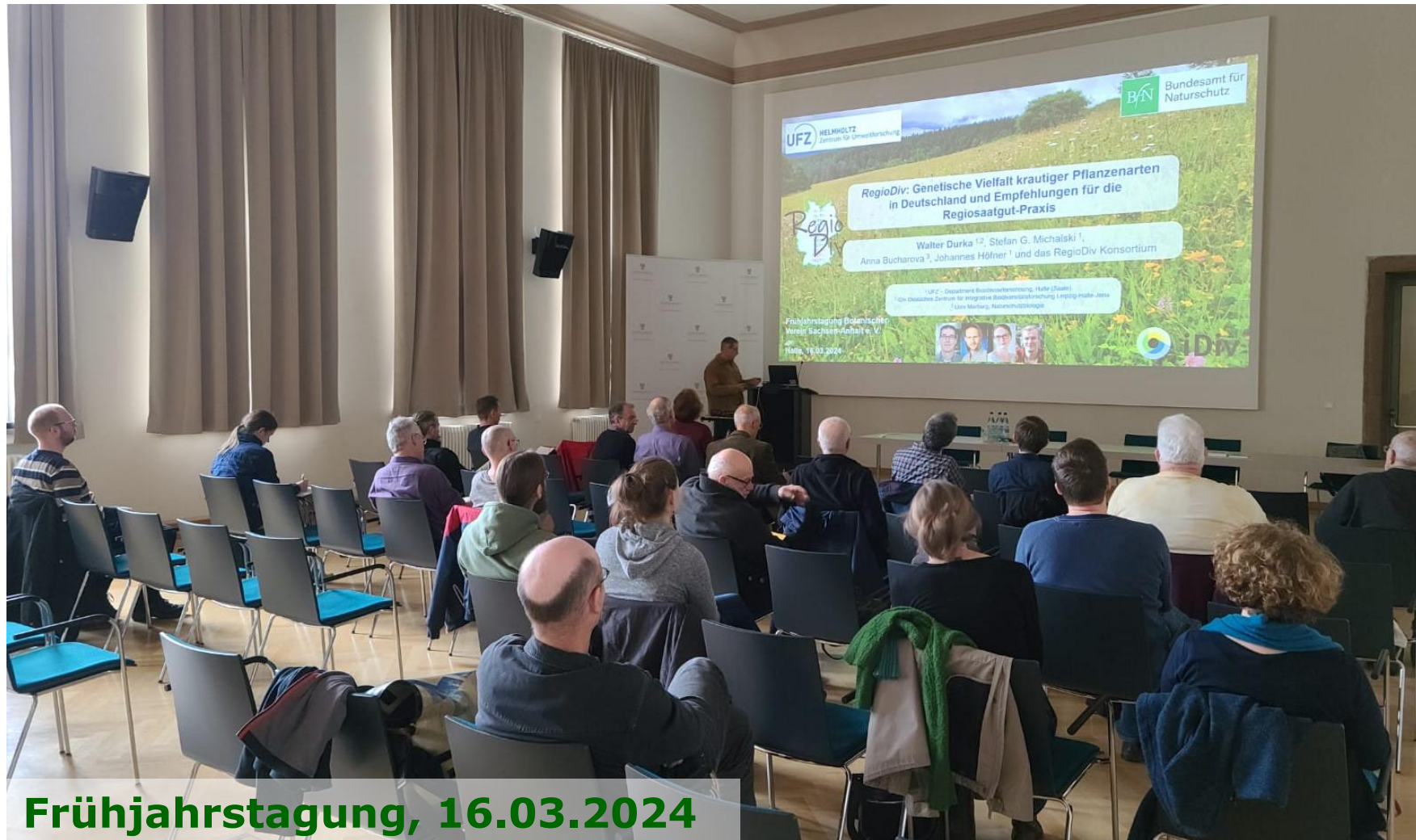
Frühjahrstagung, Landesamt für Umweltschutz, 16.03.2024